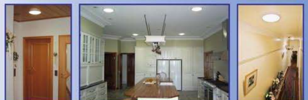
Skytube St 250 σε οικιακούς χώρους