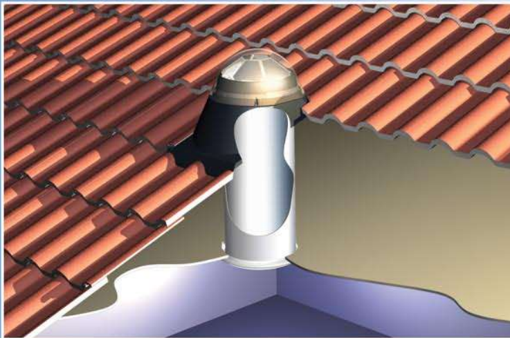
Skytube St 250